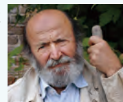
ジーノ・ジロロモーニ (1946~2012)

イタリア、ペーザロ・ウルビーノ県イゾラ・デル・ピアーノに生まれ、1970年~1980年にかけて、過疎に悩むイゾラ・デル・ピアーノの村長を務める。1974年にイゾラ・デル・ピアーノ村で効率優先の現代農業のアンチテーゼとして有機農業を始める。1977年、仲間と有機農業協同組合を設立し、代表に就任。1986年、マルケ州有機農業者協会を共同で設立。1997年、地中海有機農業協会(AMAB)を設立。同協会には現在、1万3千の有機農業法人が加盟している。