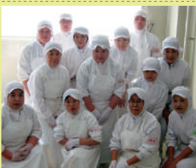
バンドラファーム工場のみなさん

原料のたねなし柿(刀根柿・平核無柿)は硫黄燻蒸せずに生産しておりますので、安心して召し上がり下さい。