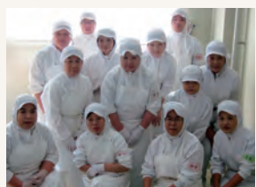
パンドラファームグループ工場のみなさん

原料のたねなし柿(刀根柿・平核無柿)は硫黄燻蒸せずに生産しておりますので、安心してお召し上がり下さい。