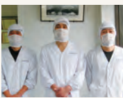
自然芋そば工場 みなさん