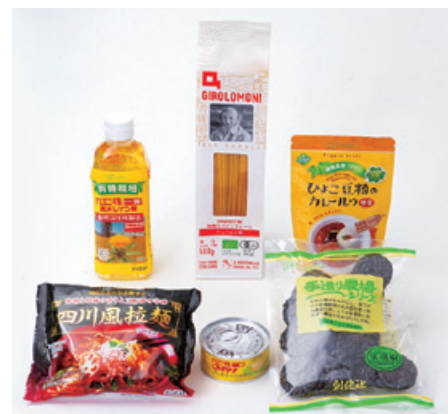
写真は優待品の一例です。