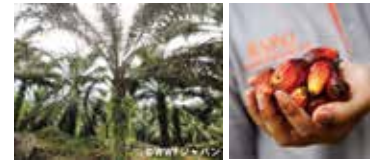
アブラヤシの木 アブラヤシの実

パーム油はアブラヤシの果実から得られる世界で最も使用量の多い植物油です。食品だけでなく化粧品・洗剤・医薬品・バイオ燃料などにも幅広く使用されています。パーム油は単位面積当たりの収量が非常に高く、現在世界で最も生産されている植物油脂です。アブラヤシの生産国アブラヤシの生産国はインドネシアとマレーシアの2国で世界のパーム油生産量の約85%を占めていますが、これらの国において諸問題が発生しています。