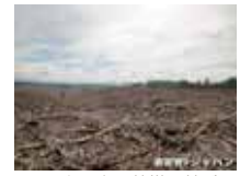
スマトラ島の熱帯雨林が伐採された跡