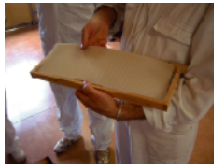
巣板にオーガニック蜜で作った巣をのせた様子