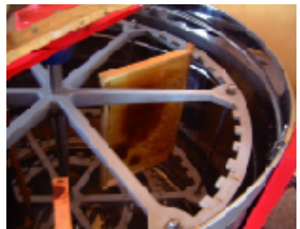
遠心分離機に巣板を1枚だけセット