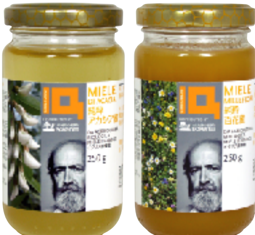
ジロロモーニ 純粋アカシア蜜