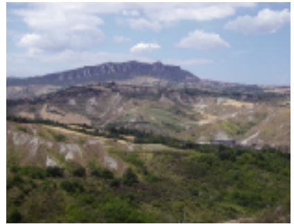
工場よりサンマリノ共和国を望む

イタリア養蜂の巣箱は、日本や他の国で使われるものよりも小型で「ダダント」という名で呼ばれています。巣板は、自分たちでオーガニックの蜜蝋を用いて作ります。採蜜は、約1ヶ月ほど採取地に巣箱を置いて、ハチミツが集まったころ夜中に巣箱を回収します。工場に持ち帰り、遠心分離機にかけて、ハチミツを採り出します。それから、2mmと0.2mmのフィルターにかけて蠟分を取り除き、熟成させます。熟成が終わり、もう一度0.2mmのフィルターにかけた後、充てんされます。冬場は、ハチミツが硬くなり作業性が落ちるので30~40℃に温めて作業を行います。決して加熱殺菌のようなことはしません。自然環境に恵まれた地域で元気なミツバチたちが採取して作り上げたハチミツを最良の状態ですべて瓶詰めしています。