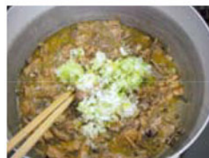
味付けいわしをほぐしネギを入れる