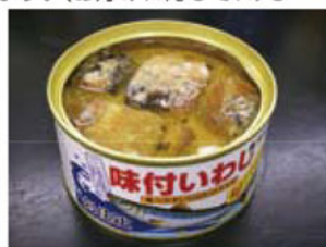
味付けいわしは汁ごと使う