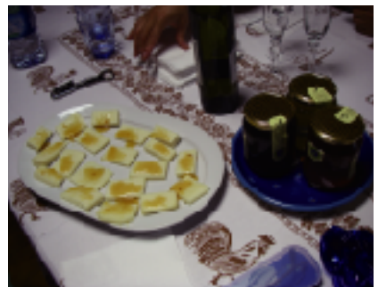
チーズにハチミツをかけて試食