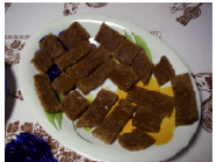
ライ麦パンにハチミツをかけて試食