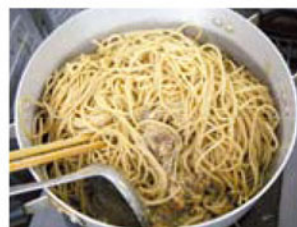
スパゲッティとあえる

スパゲッティは、やや柔らかめに仕上げたほうが食べやすいようです。お好みで味付けいわしソースは、スパゲッティと混ぜずにあとのせてもよろしいでしょう。