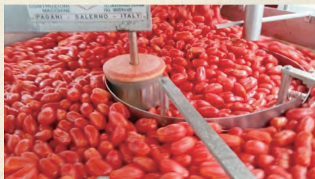
【工場内の様子②ホールトマト充填工程】