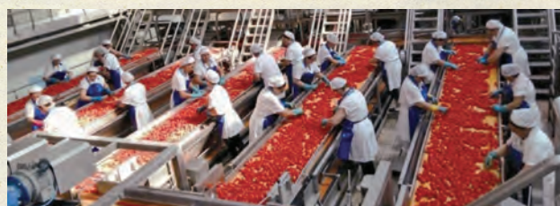
【工場内の様子①トマトの皮剥き後の選別工程】