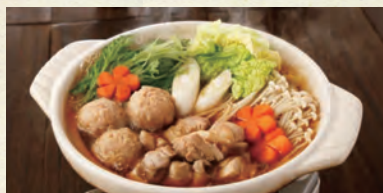
寄せ鍋(しょうゆ味)