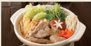
ちゃんこ鍋(みそ味)