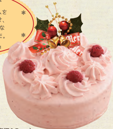
ストロベリー 4号(直径12cm)