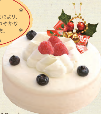
レアチーズ 4号(直径12cm)