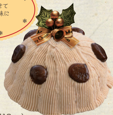
モンブラン 4号(直径12cm)