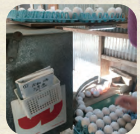
産みだした卵を自動的に採卵