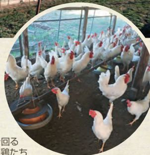
元気に動き回る 鶏たち