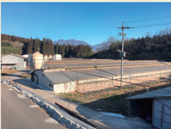
雄大な自然に囲まれた養鶏場

このように大切に育てられた鶏が生んだ有精卵の卵黄を原料に、調味料(アミノ酸等)は使用せず、圧搾製法のみでしぼった“なたね油”と“べに花油”をブレンド。あっさりまろやかな風味に仕上げました。