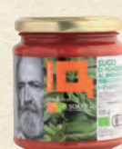
有機パスタソース トマト&バジル