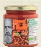
有機パスタソース アラビアータ