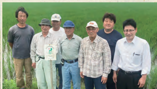
滋賀大中普及会の生産者のみなさん