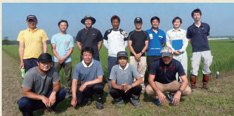
大潟村自然農法研究会生産者の皆さん